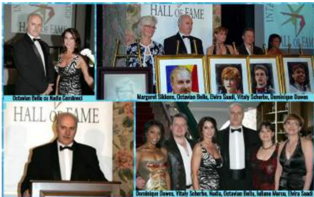
Octavian Bellu cu Nadia Comăneci